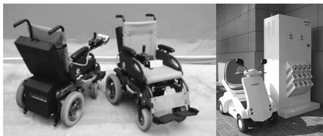
標準型電動車いす・ハンドル型・水素ストッカー

キッチンなどで浅く腰を掛けた状態で作業する、作業いすの適正寸法の決定や、座面高さ・角度や座面形状による座圧パターンの計測、さらに耐久試験方法などについては、メンバーである兵庫県立工業技術センターや神戸学院大学と当研究所が協力して支援を実施している。