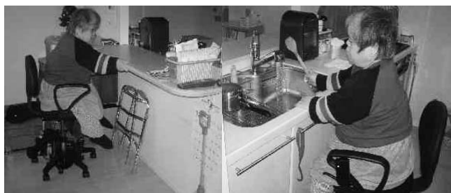
図3 カウンタを使った移動と流し台での作業状況 Fig.3 Moving about pushing-pulling furniture and working at drainboard

約4ヶ月間の試用により、従来のオフィスチェアに比較して格段に作業能率が上がったとの評価が得られた。一方、検討すべき事項は以下の通りである。