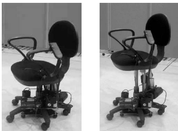
(a) 最低座面高状態 (b) 最高座面高状態

キャストによりいす全体を旋回できるが、座面単独で旋回する機構をもたせ、ロックピンの出し入れをレバーで操作する。