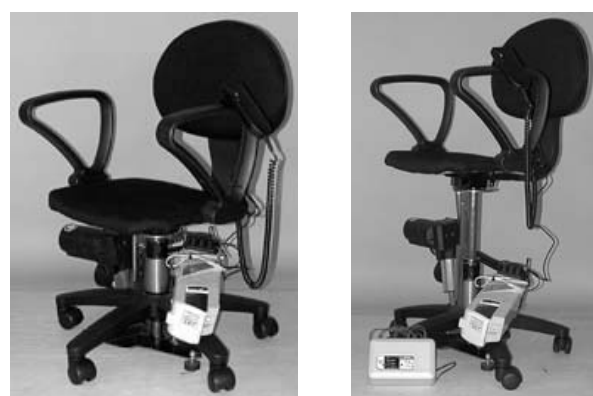
(a) 最低座面高状態 (b) 最高座面高状態