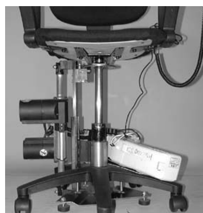
図5 改良モデルの下部構造 Fig.5 2nd Trial model of the work chair