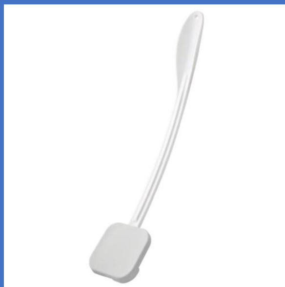
ローションアプリーケーター BA-7160