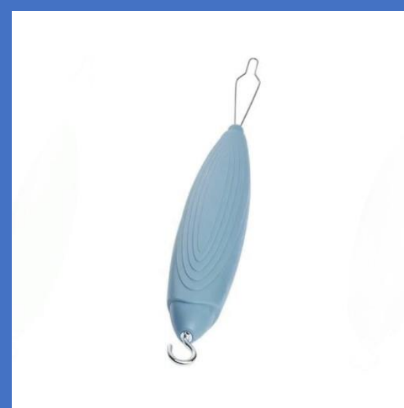
ボタン掛けファスナー フック付DA-5135