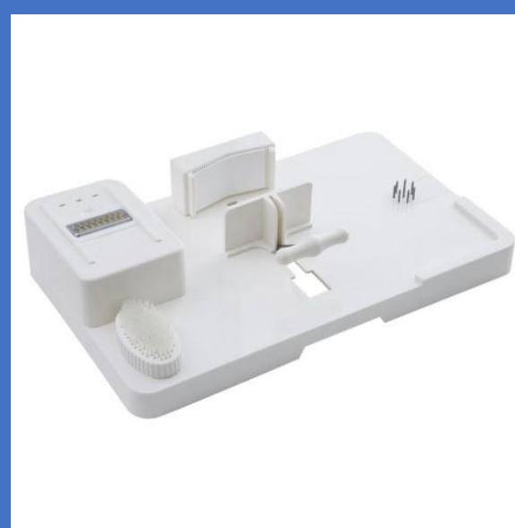
フードワークステーション HA-4193