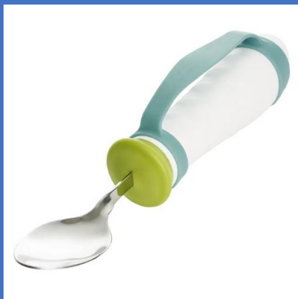
重さ調整曲げて使う スプーンHA-4391