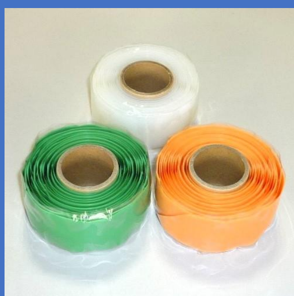
Universal Tape ユニバーサルテープ

福祉のまちづくり研究所 福祉用具展示ホール では、各種機器約700点を 展示しております。「見て、触れて、体験」をしにご来館ください。 なお、当ホールでは販売はいたしておりません。