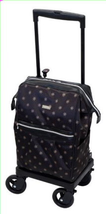
メロディスムーズ グランデ

福祉のまちづくり研究所 福祉用具展示ホール では、各種機器約700点を展示しております。 「見て、触れて、体験」をしにご来館ください。 なお、当ホールでは販売はしていません。