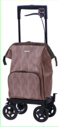
メロディプリモ グランデ