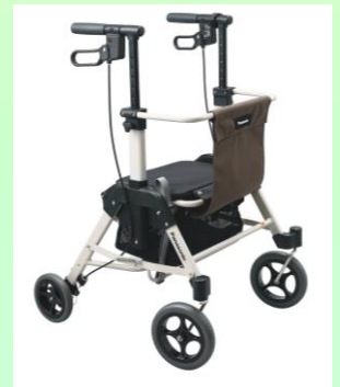
スムーディ (買物用) カウサポ