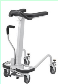
アルコーsk型mini パーキングロック付